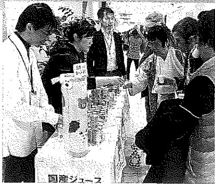
文化連も国産ジュースを販売。完売御礼。

昨年11月18日（土）、伊勢原協同病院の第33回 文化祭に伺いました。今回は道を間違えることもな く到着できました。迷わず行けば伊勢原協同病 院は小田急伊勢原駅から徒歩10分ちよつとです。 今回も文化連では国産ジュースを販売しました。 前回あつという間に売り切れたので、今回は販売 数量を増やしました。販売員も、神奈川県厚生連