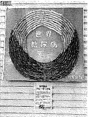
千羽鶴のブルーサークル。 カラーでお見せできないのが 残念。